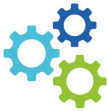
Abb. 1: Grundsätze der Zeitplanung